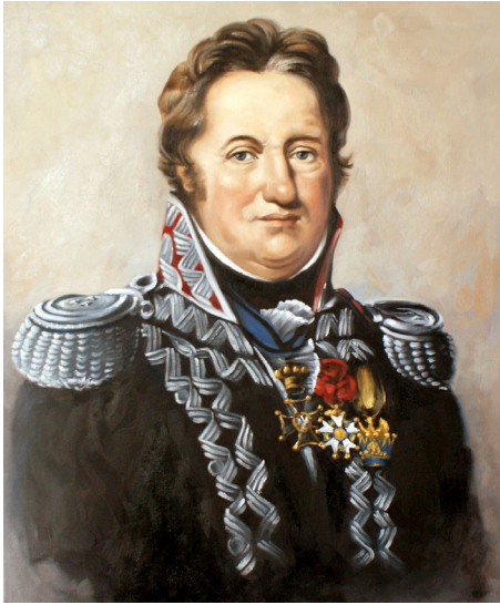
Generał Jan Henryk Dąbrowski

16. Która z osób jest autorem hymnu? Zakreśl.