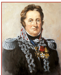
Jan Henryk Dąbrowski